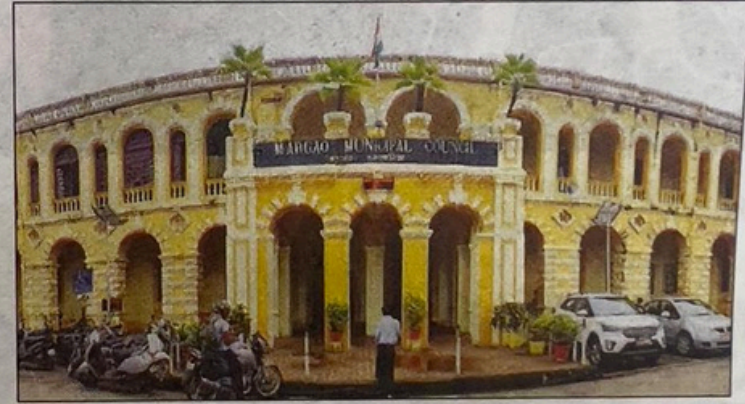
As part of the 'Swachhata Hi Seva' initiative, the MMC is planning on organising a medical camp for citizens