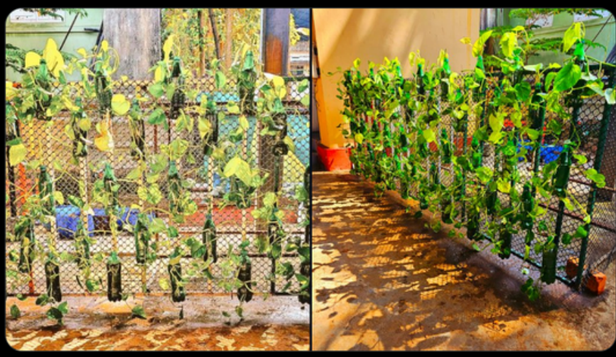
🛓 Swachh Bharat Urban and 7 others

An RRR (Reduce, Reuse, Recycle) Garden unveiled at Ernakulam North Railway Station, creatively reusing discarded plastic water bottles to nurture new life. Part of #SwachhataPakhwada2024, this initiative highlights how small efforts can make a big environmental impact! #SHS2024