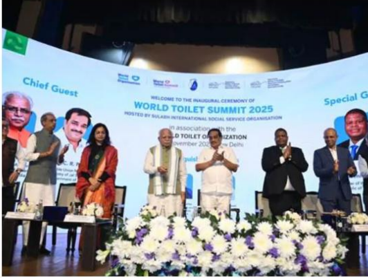
विश्व शौचालय दिवस के मौके पर आयोजित कार्यक्रम में केंद्रीय शहरी विकास मंत्री मनोहर लाल खट्टर व अन्य.

World Toilet Day-केंद्रीय मंत्री मनोहर लाल खट्टर ने कहा कि स्वच्छता की असली परीक्षा घर का बेडरूम नहीं, शौचालय होता है. उन्होंने पानी का रिसाइकल, कचरे से दौलत बनाने और बच्चों में बचपन से ही स्वच्छता की आदत डालने पर जोर दिया. सरकार अब 'आकांक्षी शौचालय' (Aspirational Toilets) बना रही है.