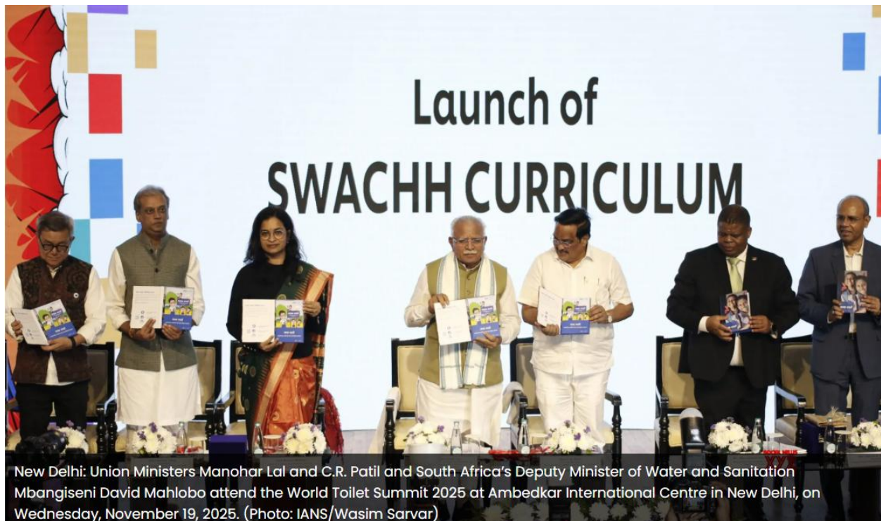
New Delhi: Union Ministers Manohar Lal and C.R. Patil and South Africa's Deputy Minister of Water and Sanitation Mbangiseni David Mahlobo attend the World Toilet Summit 2025 at Ambedkar International Centre in New Delhi, on Wednesday, November 19, 2025.