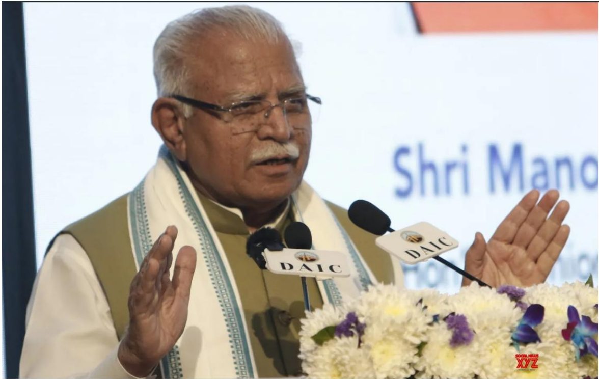
New Delhi: Union Minister Manohar Lal speaks during the World Toilet Summit 2025 at Ambedkar International Centre in New Delhi, on Wednesday, November 19, 2025.