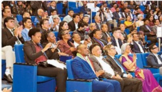
कार्यक्रम में मौजूद लोग।

का निर्माण किया जा चुका है। स्वच्छ और सुरक्षित शौचालयों तक पहुंच के कारण, दस्त से होने वाली वार्षिक मौतों को रोका जा सका है, जिससे हर