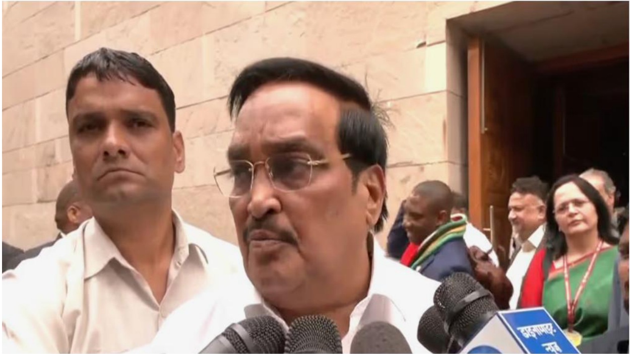
Union Minister CR Paatil

Union Minister CR Paatil, at a World Toilet Day summit, celebrated India's sanitation achievements, including 12 crore toilets and clean water for 15 crore homes. He reaffirmed the government's commitment to quality water under the Jal Jeevan Mission.