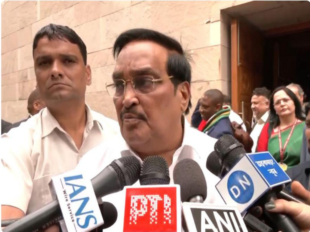
Union Minister CR Paatil