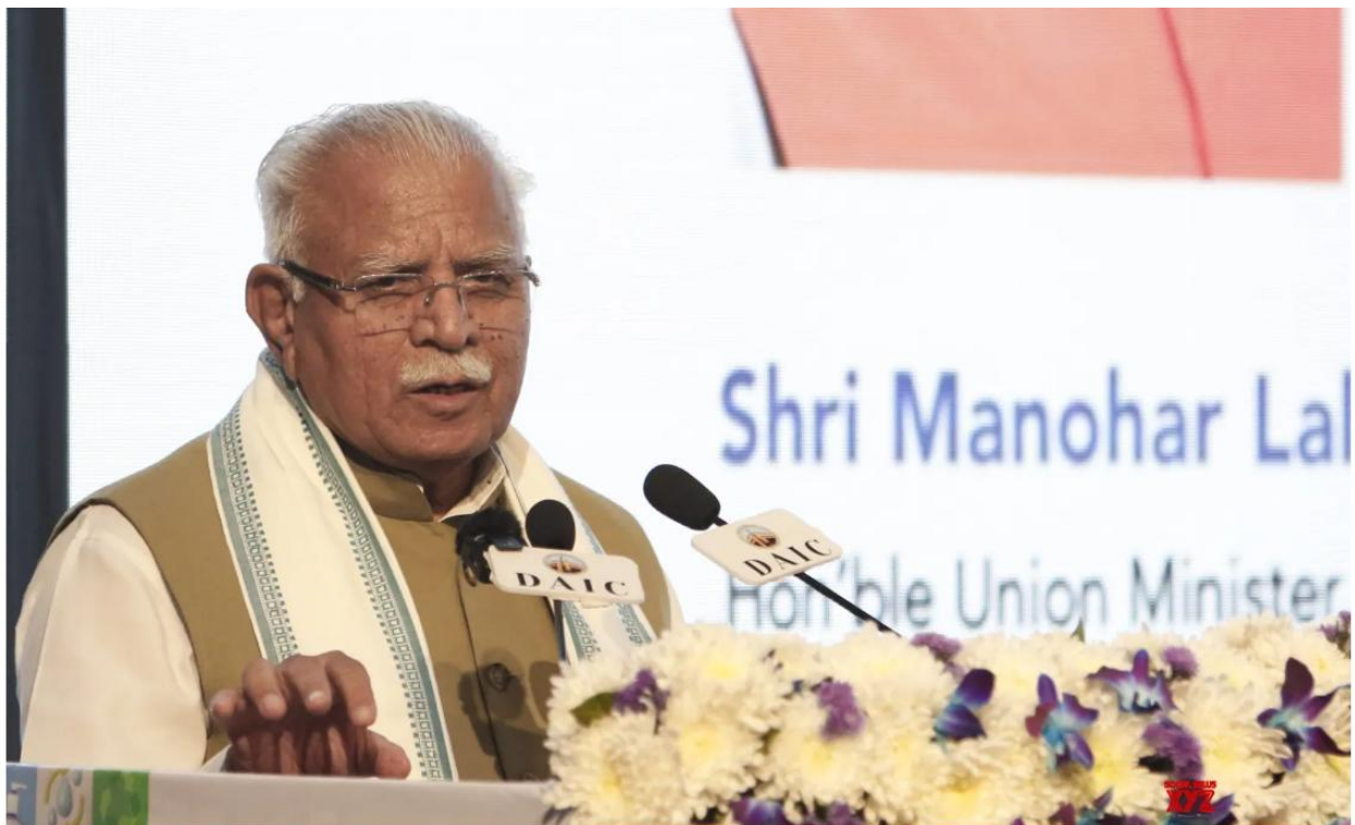
New Delhi: Union Minister Manohar Lal speaks during the World Toilet Summit 2025 at Ambedkar International Centre in New Delhi, on Wednesday, November 19, 2025.