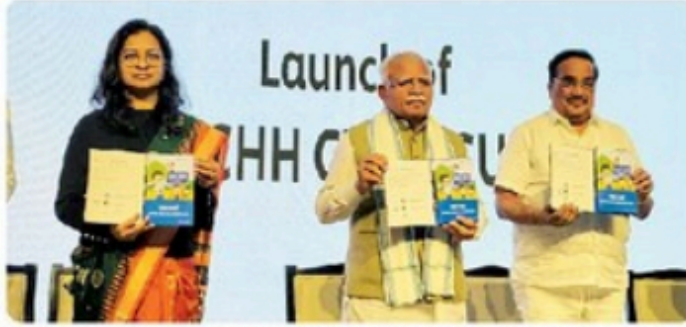
अम्बेडकर इंटरनेशनल सेंटर में आयोजित वर्ल्ड टॉयलेट समिट 2025 के उद्घाटन सत्र में केन्द्रीय मंत्री मनोहर लाल, केन्द्रीय मंत्री सीआर पाटील और अन्य

समारोह में केन्द्रीय जल शक्ति मंत्री सीआर पाटील ने बताया कि ग्रामीण क्षेत्रों में 12 करोड़ शौचालयों