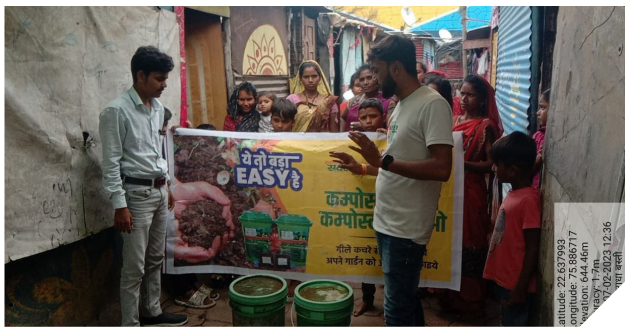
Indore conducted 'Yeh Toh Bada Easy Hai' campaign in July 2023, where slum residents were informed about home composting.