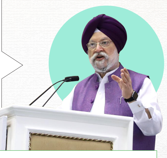
SHRI HARDEEP SINGH PURI Union Minister, MoHUA

"In SBM-U 2.0, the second phase of PM Shri Narendra Modi Ji's visionary Swachh Bharat Mission focuses on making cities garbage free along with sewage & safety management, making cities water secure & ensuring that dirty drains do not merge into rivers."