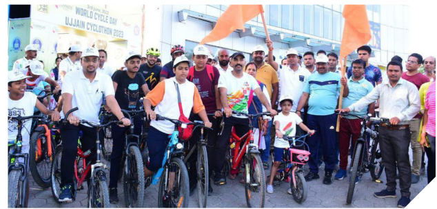
Cyclothons were organized in Ranchi and Ujjain on World Bicycle Day, June 3, 2023, to raise awareness on 3Rs.