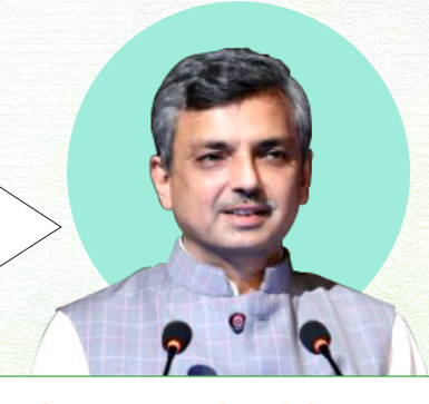
SHRI MANOJ JOSHI Secretary, MoHUA

"We are committed to transforming manholes into machine holes. As of now approx. 25% of cities already possess adequate equipment and we anticipate complete mechanization transition by 2026."