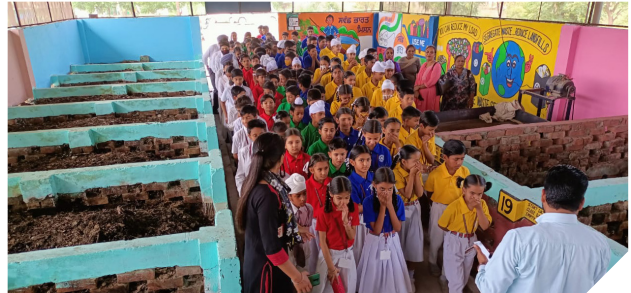
School students visit Kurali's Waste management centre in Punjab to learn about waste segregation and composting.