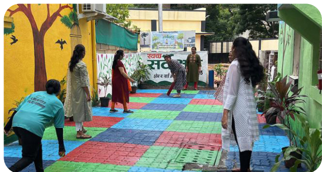
Pimpri Chinchwaad's team Swachh inaugurated the beautiful 'Aadarsh back lanes', where a group of women enjoyed a game of cricket.

Chandigarh Municipal Corporation conducts cleanliness drive in 600 Back Lanes weekly.