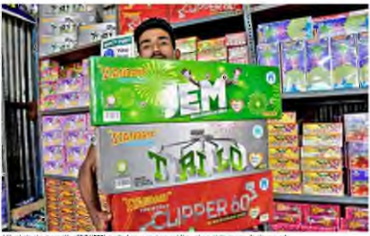
A file photo of a group of CSIR-NEERI staffed green crackers and fireworks at a Kumbh Mela playground.

What they are made of Green firecrackers are made by reduced use of shell, elimination of lead, reduced use of raw material in the