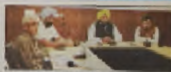
नगर निगम एकीकृतों को सुरक्षित दीवाली मनाने के लिए जरूरी प्रबंध करने के लिए निर्देश