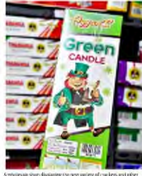
A close-up view of a box of Green Candle firecrackers, showing the product name and a cartoon character.

police department, the civic body will help identify and each vendor selling non-green crackers. "It is the duty of the police department to keep track of vendors and vendors who will sell non-green crackers, as the licensing authority has been given to the police commissioner, and not the BMC." The BMC is responsible and authorised to only identify and allocate locations where the retailers can store and put up their stalls. The police department will conduct inspections, draw samples for lab tests, and do frequent checks of the stalls and the vendors. However, the police department will assist the police department. We have prepared guidelines for our staff to understand their role at these stalls and how they must support the police department. The BMC staff and inspectors will work along with the police and report to them about vendors in order to book cases," Mr. Chitambar said.