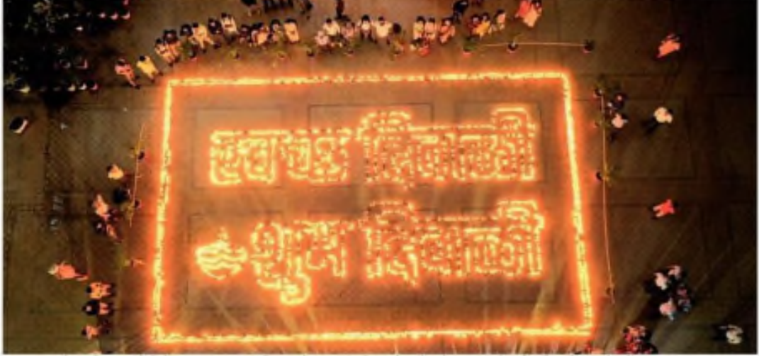
मनपा कार्यालय में 5000 दीयों से प्रकाशमय हुआ परिसर, लोकल फॉर वोकल के संदेश के साथ पर्यावरणीय दिवाली मनाई गई.