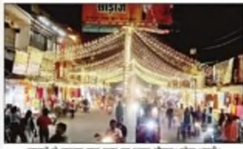
इसानी से सजेगा नया शहर का मुख्य चौक। लोक भारती।