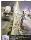
सड़कों पर सुगंध करने नया प्रकल्प।