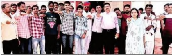
बौरावड़। स्वच्छ भारत मिशन के तहत स्वच्छ दिवाली-शुभ दिवाली की शपथ दिलाई गई।