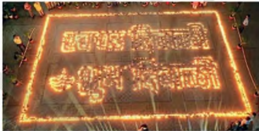
नागपुर : पर्यावरणपूरक आणि ‘व्होकल फॉर लोकल’ मोहीमचा संदेश देण्यासाठी महापालिकेच्यावतीने तयार पाच हजार मीटरचे दिवे प्रज्वलित करण्यात आले.

नागपुर, ना. ६ : महानगरपालिकाचे ‘स्वच्छ शिवाजी शुभ दिवाळी’ मोहीम राबविण्यात येत आहे. यावेळी पाच हजार दिव्यांच्या पर्यावरणपूरक दिवाळी आणि ‘व्होकल फॉर लोकल’चा संदेश देण्यात आला.