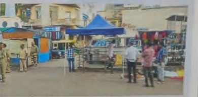
ಬೆಂಗಳೂರು: ಹುತಾತ್ಮಾ ಚೌಕಾತ ಜಾಗೃತಿ ಕಕ್ಷ ಸ್ಥಾಪನೆ ಮತ್ತು ಅಪಾಯಕಾರಕ ಫಟಾಕೆ, ಪ್ಲಾಸ್ಟಿಕ್‌ವರ ಕಾರವಾಡ್.

ಈ ಸಂದರ್ಭದಲ್ಲಿ ಮಹಾಪಾಲಿಕೆಯು ಸ್ವಚ್ಛತೆ ಮತ್ತು ಸುಸ್ಥಿರತೆಗೆ ಸಾಕಷ್ಟು ಗುರಿಯನ್ನು ಹಿಡಿದು, 'ಸ್ವಚ್ಛ-ಶುಭ ದಿವಾಳಿ' ಅಭಿಯಾನವನ್ನು ಆರಂಭಿಸಿದೆ. ಈ ಅಭಿಯಾನವು ಪುರಸಭೆಯು ಆಯಾ ವಾರಗಳಲ್ಲಿ ನಡೆಸುವ ಸ್ವಚ್ಛತೆ ಮತ್ತು ಸುಸ್ಥಿರತೆಗೆ ಸಾಕಷ್ಟು ಗುರಿಯನ್ನು ಹಿಡಿದು, 'ಸ್ವಚ್ಛ-ಶುಭ ದಿವಾಳಿ' ಅಭಿಯಾನವನ್ನು ಆರಂಭಿಸಿದೆ.