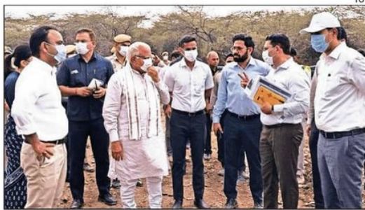
The minister has ordered regular drone surveys of the landfill site

He directed officials to increase the number of agencies working at the site and warned against any laxity in clearing the garbage mountain. "Identify an alternative site for fresh waste dumping so that newly generated mu-