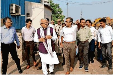
भलस्वा लैंडफिल साइट के निरीक्षण करते केंद्रीय मंत्री मनोहर लाल

केंद्रीय मंत्री मनोहर लाल नगर निगम के वरिष्ठ अधिकारियों के साथ भलस्वा लैंडफिल साइट पहुंचे। वहाँ चल रहे बायोमाइनिंग